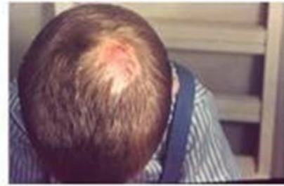
Ringworm on the scalp