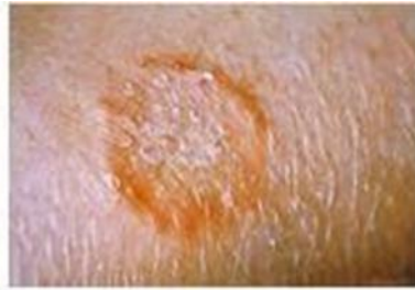
Ringworm on the arm